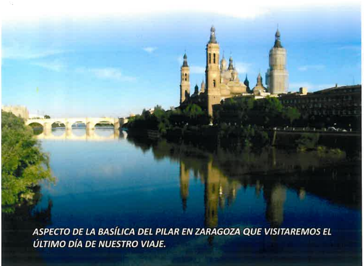
ASPECTO DE LA BASÍLICA DEL PILAR EN ZARAGOZA QUE VISITAREMOS EL ÚLTIMO DÍA DE NUESTRO VIAJE.